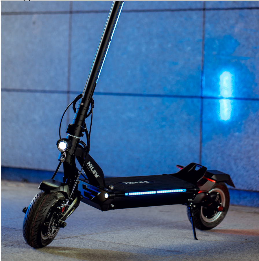
Boczne paski LED RGB

Boczne paski LED RGB sprawiają, że nasz Tiger jest nie do przecenienia w nocy. Podest i kolumna są podświetlane efektownymi paskami LED, których kolor i styl możesz dostosować za pomocą dedykowanej aplikacji.